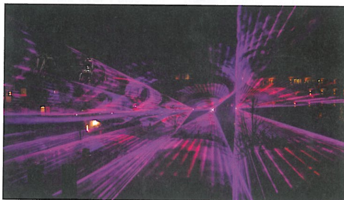
Zum Jahreswechsel wurde in St. Anton wiederum eine hochprofessionelle Lasershow geboten.